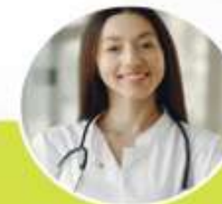
PEMBICARA 2 JUDUL MATERI