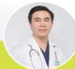
PEMBICARA 1 JUDUL MATERI