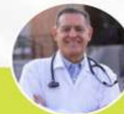
PEMBICARA 3 JUDUL MATERI